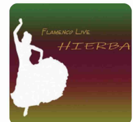
HIERBA [イエルバ] (14:30~)